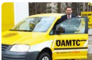
ÖAMTC ist sicher unterwegs mit Erdgas