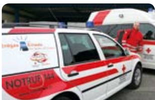
ÖÖ Rotes Kreuz fährt bereits 3 Erdgas-Autos