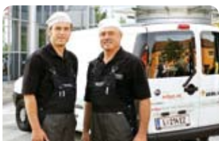
Erdgas als kostengünstiger Flottenkraftstoff für das Gewerbe