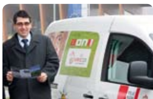
Die Telekom ist umweltfreundlich mit Erdgas unterwegs