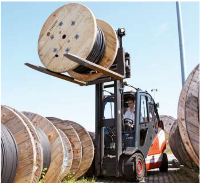
Umweltfreundlicher Betrieb: erdgasbetriebener Stapler bei Kabel Meinhart.

Auch bei der österreichischen Post AG setzt man auf moderne, zuverlässige, sparsame und die Umwelt schonende Erdgas-Fahrzeuge. In Gmunden sind 19 erdgasbetriebene Zustellfahrzeuge im Einsatz.